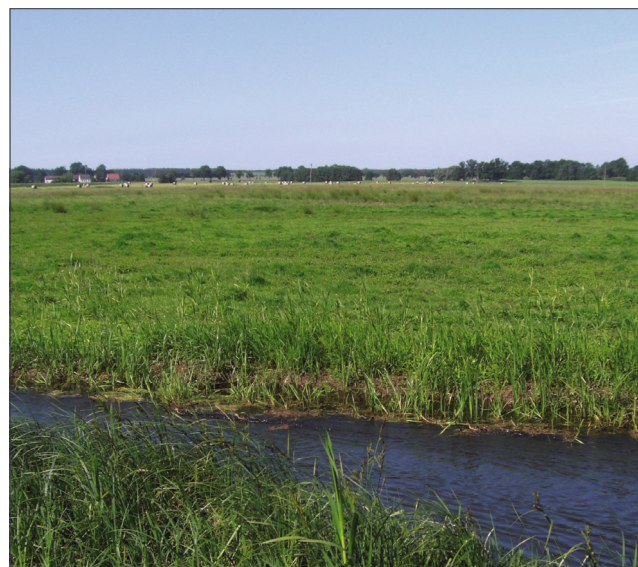
Polder Kieve aktuell