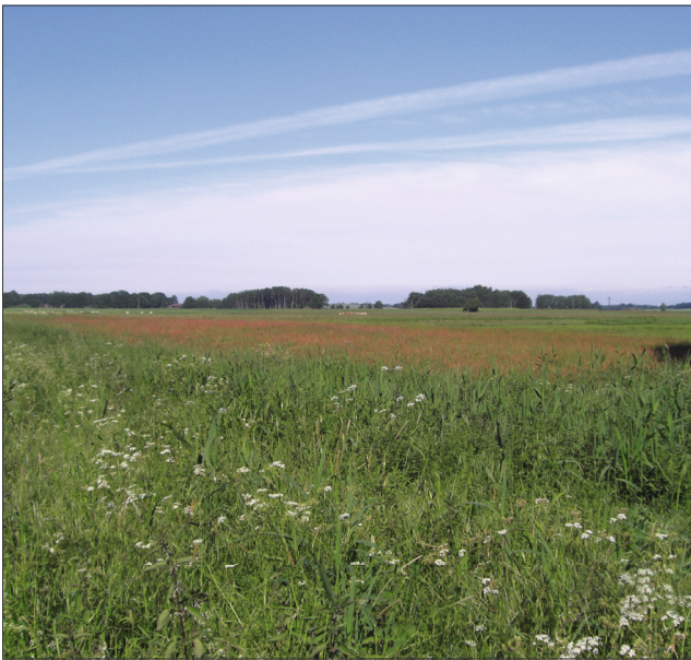
Polder Kieve im Sommer

Modell davon ausgegangen werden, dass 14.325 Tonnen Kohlendioxidäquivalente weniger emittiert werden als bei Beibehaltung des Status quo. Dies ergibt, bezogen auf die Gesamtkosten des Projektes, einen Preis von 35 € für ein MoorFuture. Da ein MoorFuture einer vermiedenen Tonne Kohlendioxidäquivalente entspricht, können für dieses Projekt 14.325 MoorFutures verkauft werden.